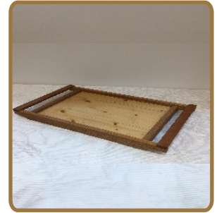
원목트레이 (원목, 천연오일 마감) 600*300*120 / 15,000원