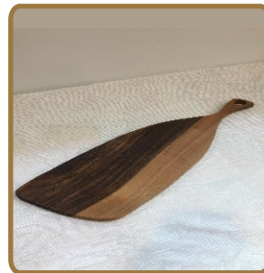
빵도마 (원목, 천연오일 마감) 600*150*20 / 30,000원