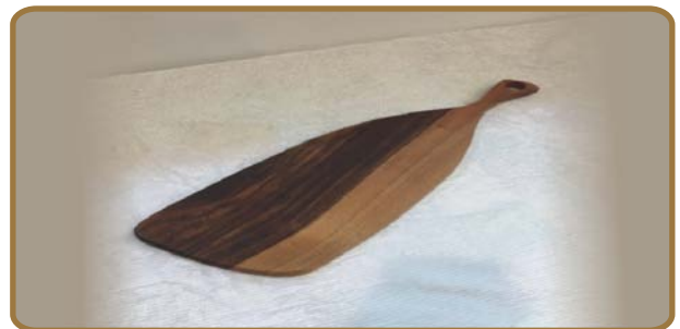
빵도마 (원목, 천연오일 마감) 600*150*20 / 30,000원