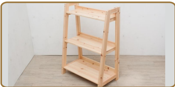
사다리모양선반 (집성목, 천연오일 마감) 600*300*1200 / 50,000원