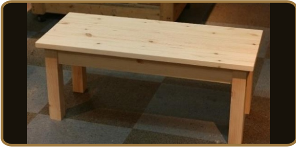
벤치 (집성목, 천연오일 마감) 1200*300*1450 / 40,000원