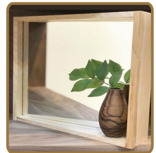
벽걸이거울 (원목, 천연오일 마감) 310*50*310 / 20,000원