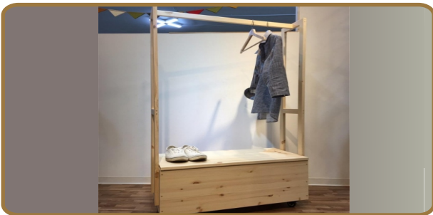
원목행거 (집성목, 천연오일 마감) 800*400*1400 / 80,000원