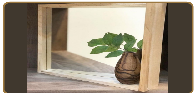
벽걸이거울 (원목, 천연오일 마감) 310*50*310 / 20,000원